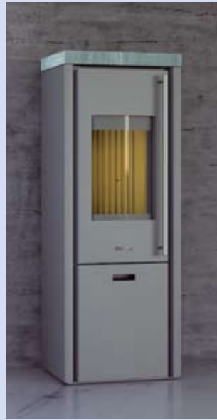
Santorini Compact mit Stahlverkleidung und Natursteinabdeckung