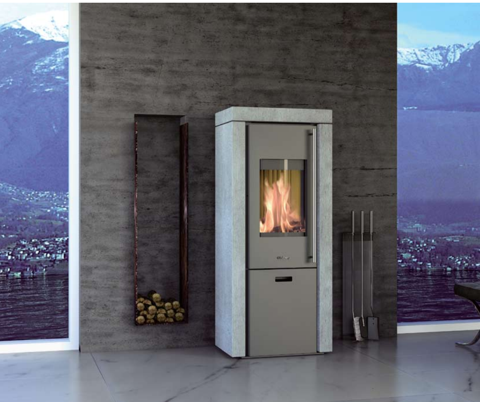
Santorini Compact mit Natursteinverkleidung