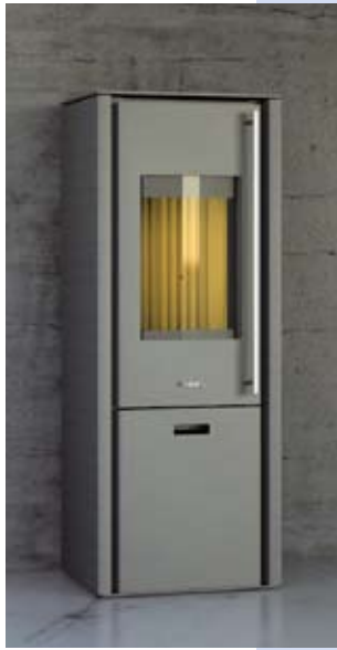
Santorini Compact mit Stahlverkleidung