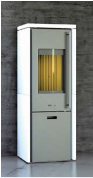
Santorini Compact mit Keramikverkleidung schneeweiß